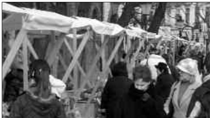
Nastavak na 3. strani

Sam vašar je bio uspešan, ali s postignutim rezultatima nisu zadovoljni u JKP, pošto je u realizaciji vašara osnivač nije pružio očekivanu podršku. O tome detaljnije na 3. strani.