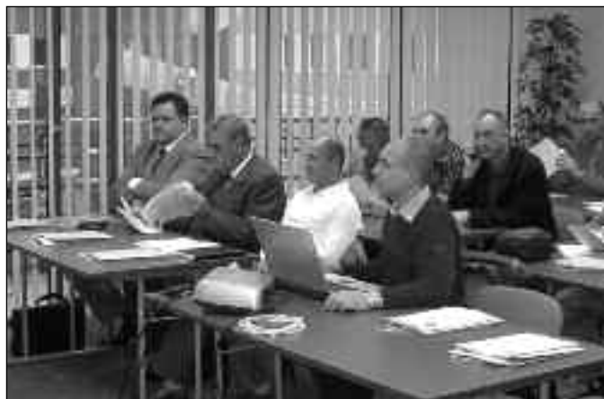
Sa subotičke sednice upravnog odbora PUPS-a

Od 24. do 27. marta u Nišu će se održati skup članova Poslovnog udruženja „Udruženja pijaca Srbije”. Prvo će zasedati upravni odbor PUPS-a, a zatim će se održati redovna godišnja Skupština poslovnog udruženja, kada će se sumirati rezultati jednogodišnjeg rada i odrediti se najvažniji zadaci za naredni period. Pored toga podneće se informacija o novoj verziji nacrtu zakona o trgovini, zatim informacija o drugom godišnjem forumu na temu „Restrukturiranje i privatizacija javnih preduzeća i javnih komunalnih preduzeća u Srbiji”.